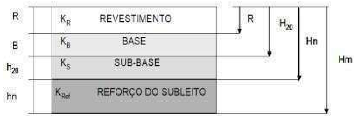
Figura 03. Dimensionamento de pavimento flexível